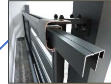
Guía con rodillos

Recubrimiento del relleno de la cancela sobre el pilar variable según el largo pedido