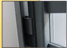
Perfil de recepción + tope de recepción