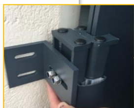
Butée de réception et butée de centrage côté fermeture du portail

ATTENTION CE N'EST PAS LA LARGEUR DU PORTAIL